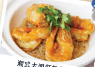
潮式大明虾粉丝煲

想要款待自己吗？今天就去醉花林品潮轩品尝美味可口的潮州系新菜式吧。我们为您精选了11种各式各样的美味佳肴：潮州风味的潮式大明虾粉丝煲，草菇蹄根扒陈皮鸭，鲍汁鲜掌鱼肚扣10头鲍鱼等多种珍馐美味，一定要带您的亲朋好友来一起享受哦！