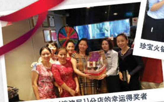
珍宝火锅（淡滨尼1）分店的幸运得奖者