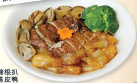
草菇蹄根扒陈皮鸭