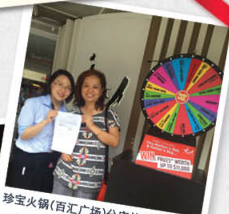
珍宝火锅（百汇广场）分店的幸运得奖者