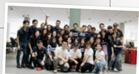
BONDUE第十一届执行委员会和 珍宝员工的大合照