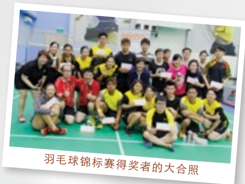
羽毛球锦标赛得奖者的大合照

我们给予男双、女双、混双这三个奖项的冠军获得者以最热烈的祝贺。各个冠军队伍能获得$500的餐券以及奖杯。亚军、季军以及殿军能分别获得$400、$300、以及$200的餐券以资鼓励。